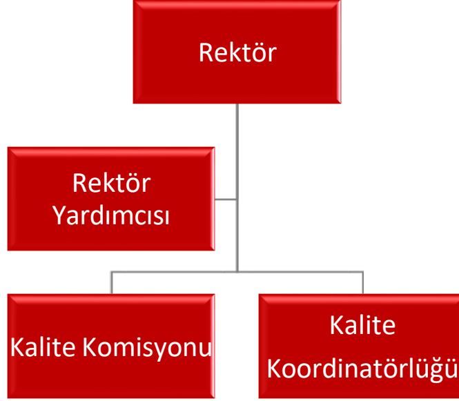
Şekil 2: Kalite Güvence Sistemi Organizasyon Şeması

meslek yüksekokulunu temsilen birden fazla olmamak üzere farklı bilim alanlarını ve idari birimleri temsilen akademik ve idari personel, merkez müdürlüklerini temsilen ilgili rektör yardımcı ile öğrenci konsey başkanından oluşan Kalite Komisyonu kurulmuştur. Ayrıca Üniversitede kalite güvence yönetim sisteminin kurulması ve yönetilmesi amacıyla Rektörün görevlendireceği bir koordinatör başkanlığında öğretim elemanları ve idari çalışanlardan oluşan en az iki (2) koordinatör yardımcısının görevlendirildiği Kalite Koordinatörlüğü oluşturulmuştur.